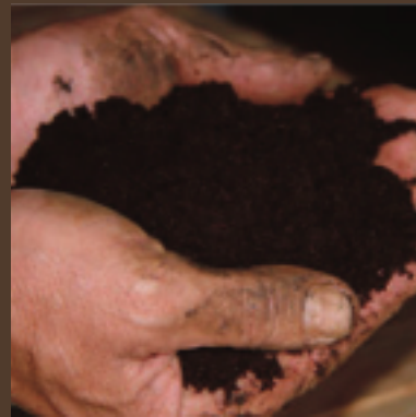
Bouse de Corne

La préparation de silice de corne, dite 501, est une « pulvérisation lumière ». Non seulement elle renforce la lumière solaire, mais elle permet aussi une meilleure relation avec la périphérie cosmique, avec le cosmos.