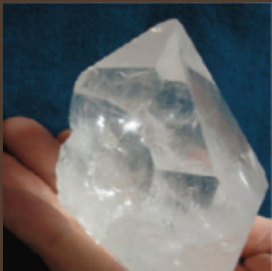
Silice de Corne

La préparation de Chamomille est liée au métabolisme du calcium, elle régularise le processus e l'azote.